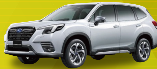
スバル フォレスター Touring