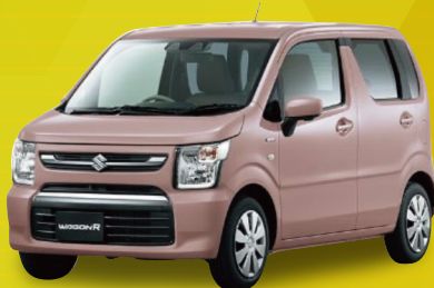
スズキ ワゴンR FX