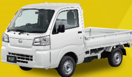
ダイハツ ハイゼットトラック スタンダード