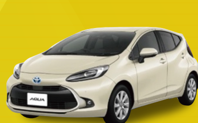
トヨタ アクア X