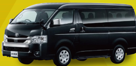
トヨタ ハイエースワゴン DX 4ドア 10人