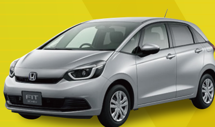
ホンダ フィット e:HEV BASIC