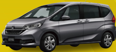
ホンダ フリード HYBRID G 6人乗り

御社の車の処分代行も実施中(オークション出品・廃車処分) お車の適正処分により、リユースやリサイクルに貢献しています。