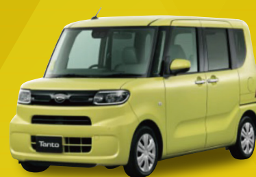
ダイハツ タント L