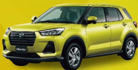
ダイハツ ロッキー L