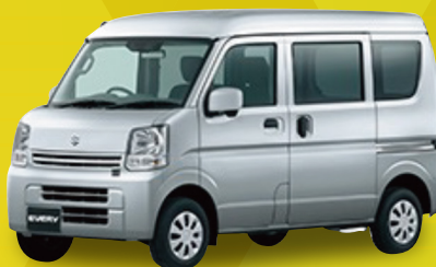
スズキ エブリイ PC