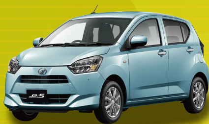
ダイハツ ミライース L SAIII