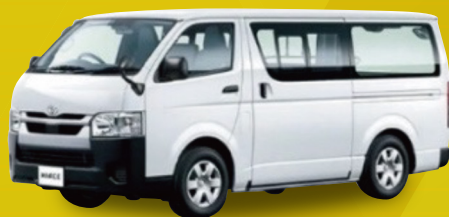
トヨタ ハイエースバン DX 4ドア 3/6人