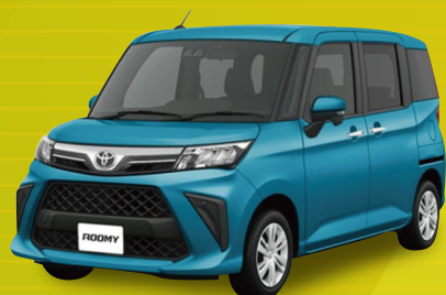
トヨタ ルーミー X