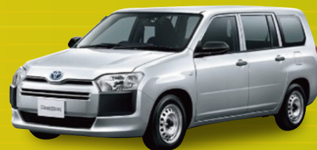
トヨタ プロボックス G