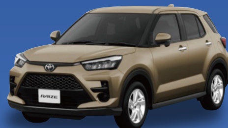
トヨタ ライズ X SUV 1,000cc 4WD CVT

月々 43,800円 月々 39,300円 (税込金額 48,180円) (税込金額 43,230円)