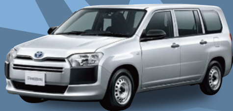
トヨタ プロボックス G 小型貨物 1,500cc 4WD CVT

月々 19,400円 月々 16,600円 (税込金額 21,340円) (税込金額 18,260円)