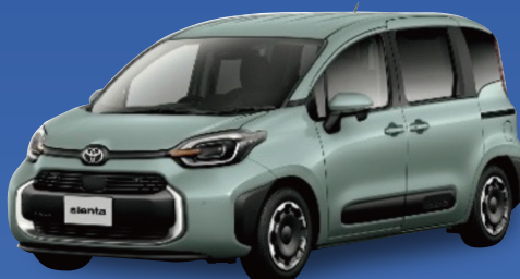
トヨタ シエンタ HYBRID X ハイブリッド 5人乗り ミニバン 1,500cc E-Four CVT

月々 43,600円 月々 39,700円 (税込金額 47,960円) (税込金額 43,670円)