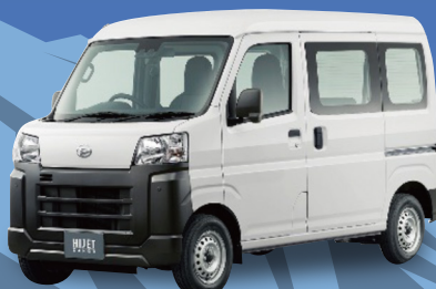
ダイハツ ハイゼットカーゴ スペシャル 軽貨物 660cc 4WD CVT

月々 50,800円 月々 43,500円 (税込金額 55,880円) (税込金額 47,850円)