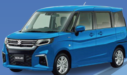
スズキ ソリオ HYBRID MX