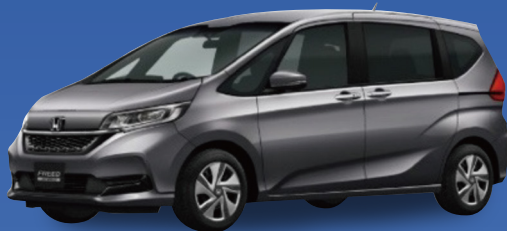
ホンダ フリード HYBRID G ハイブリッド 6人乗り ミニバン 1,500cc 4WD CVT

御社の車の処分代行も実施中(オークション出品・廃車処分) お車の適正処分により、リユースやリサイクルに貢献しています。