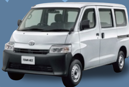
トヨタ タウンエースバン DX 小型貨物 1,500cc 4WD 4AT

月々 33,700円 月々 26,600円 (税込金額 37,070円) (税込金額 29,260円)