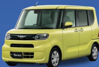
ダイハツ タント L