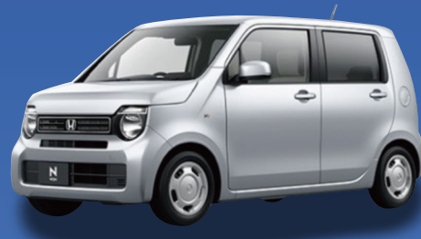
ホンダ N-WGN G