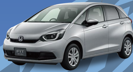
ホンダ フィット e:HEV BASIC