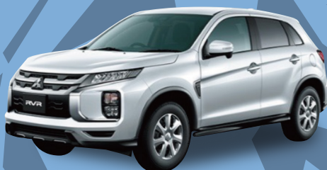
三菱 RVR M SUV 1,800cc 4WD CVT

月々 34,900円 月々 29,600円 (税込金額 38,390円) (税込金額 32,560円)