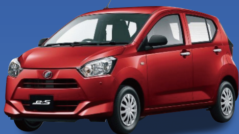
ダイハツ ミライース L SAIII