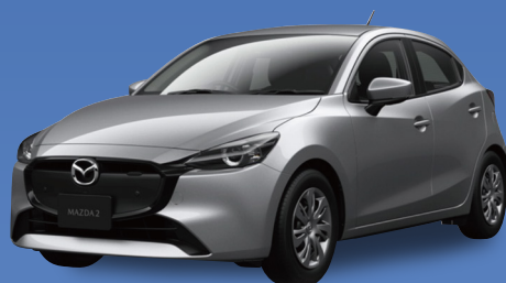
マツダ MAZDA2 15C