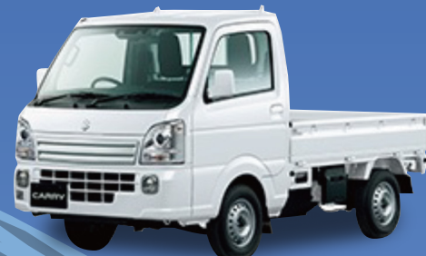
スズキ キャリイ KC エアコン・パワステ 軽貨物 660cc 4WD 4AT

月々 23,200円 月々 19,700円 (税込金額 25,520円) (税込金額 21,670円)